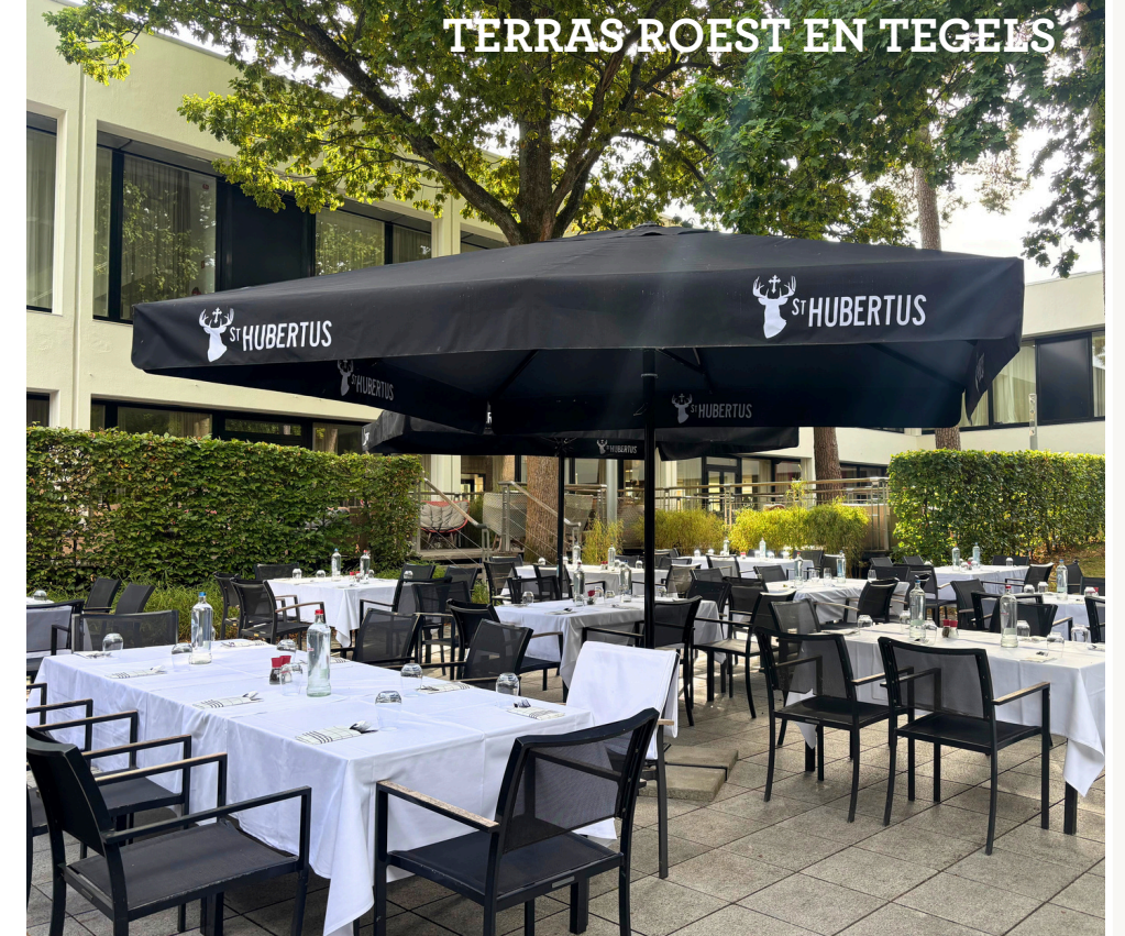
TERRAS ROEST EN TEGELS