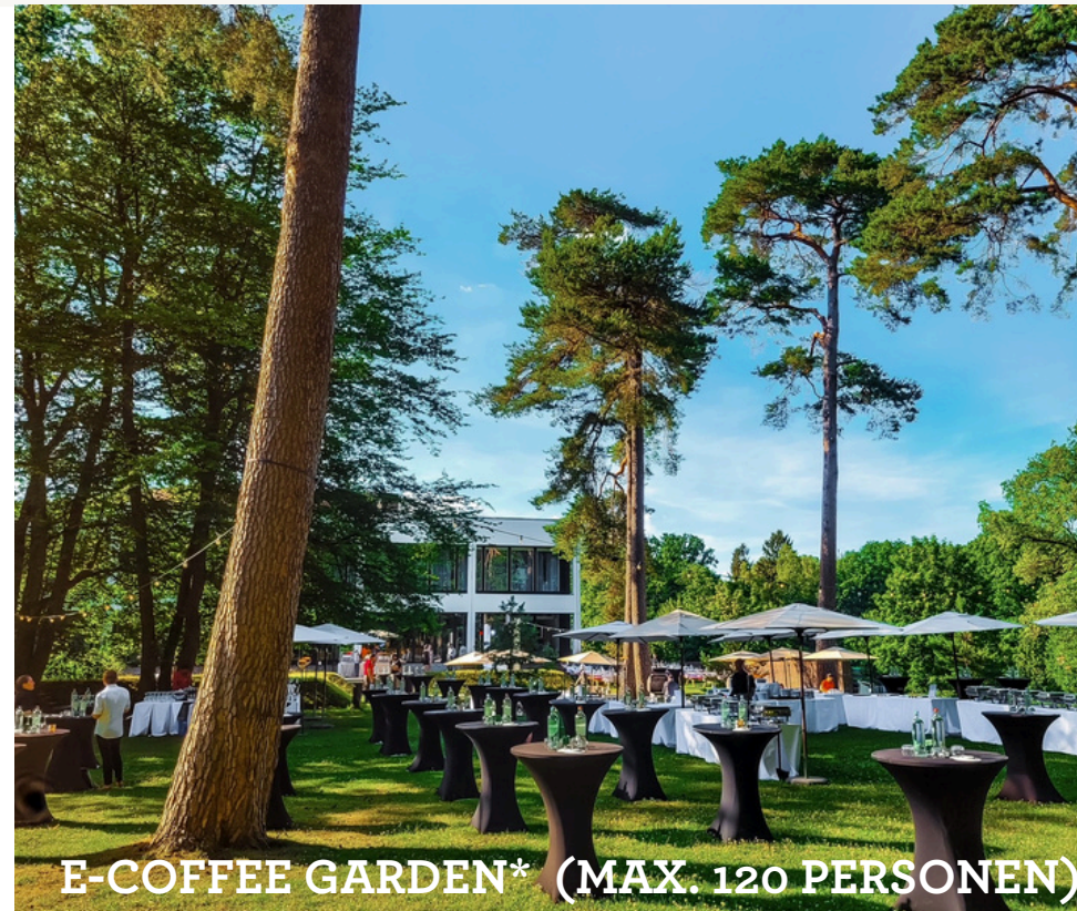
E-COFFEE GARDEN* (MAX. 120 PERSONEN)

*€ 15 extra per persson voor de installatie van de apparatuur